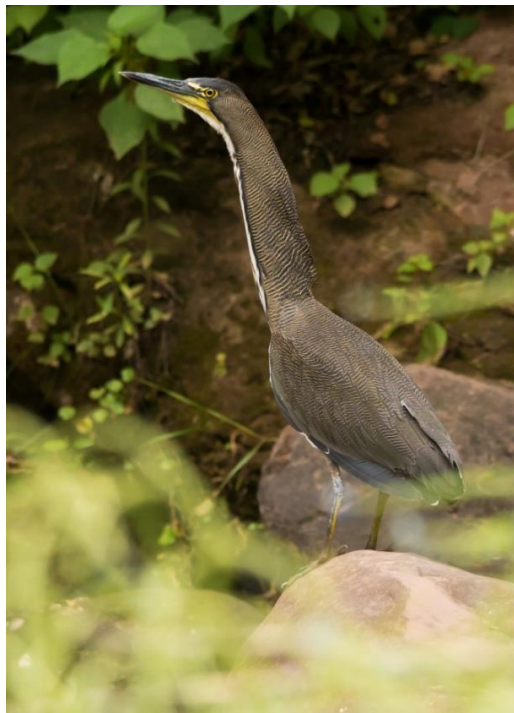
Hocó oscuro ( Tigrisoma fasciatum )