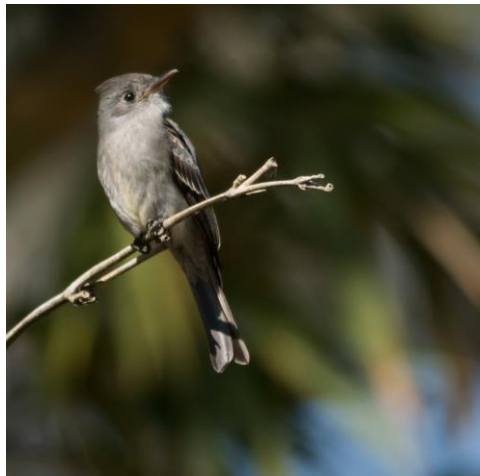
Burlisto copetón ( Contopus fumigatus )