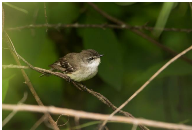
Piojito gargantilla ( Mecocerculus leucophrys )