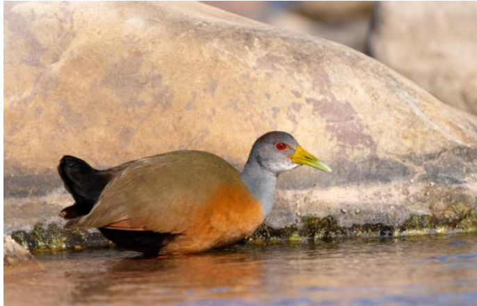
Chiricote ( Aramides cajanea )