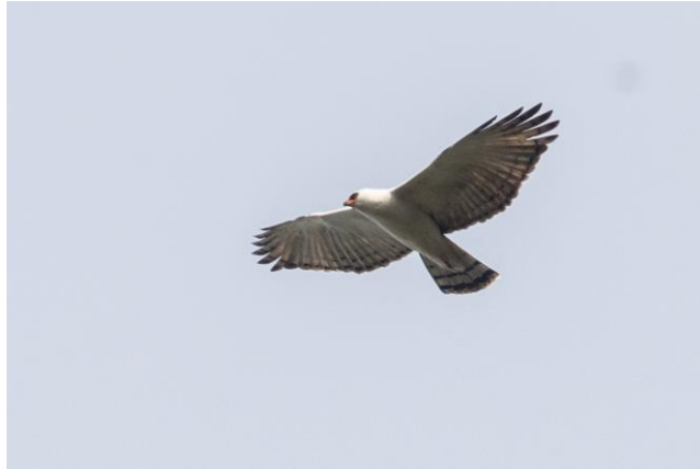
Águila viuda ( Spizaetus melanoleucus )